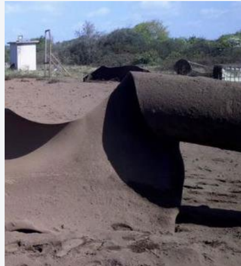
Berstversuch an einer CO 2 -Testleitung. CO 2 -Gemisch (94,0 % CO 2 ) bei 127 bar, in der Werkstoffgüte X65, bei einer Abmessung von 610 x 13,7 mm, aus dem RFCS-geförderten Projekt „SARCO2“. Rissstopp im Stahlrohr nach wenigen Metern.