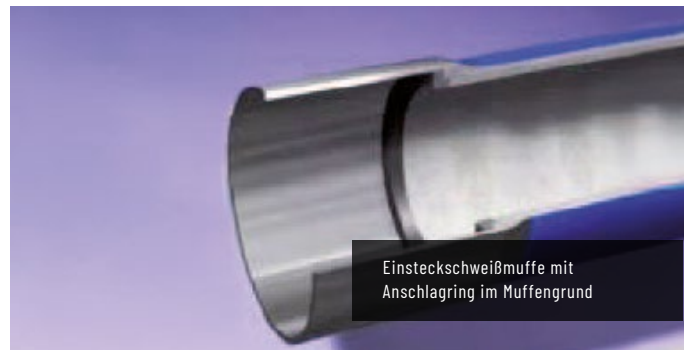
Einsteckschweißmuffe mit Anschlagring im Muffengrund

Eine Erweiterung des Anwendungsbereiches ist nach zusätzlichen Felduntersuchungen möglich.